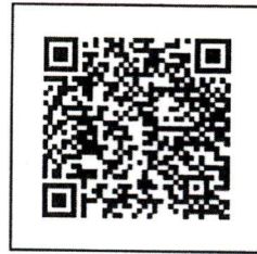
คู่มือการประกวดฯ